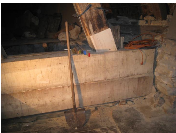
Opravené zhlaví u vstupu do zvonice