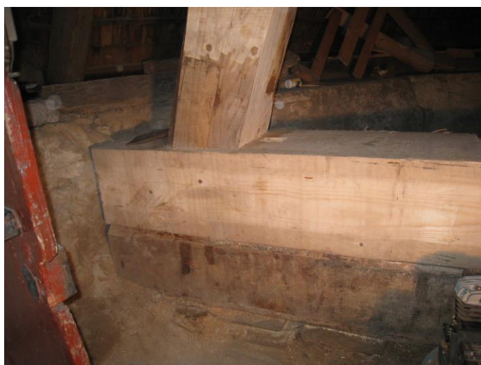
Opravené zhlaví včetně části vyměněné vzpěry