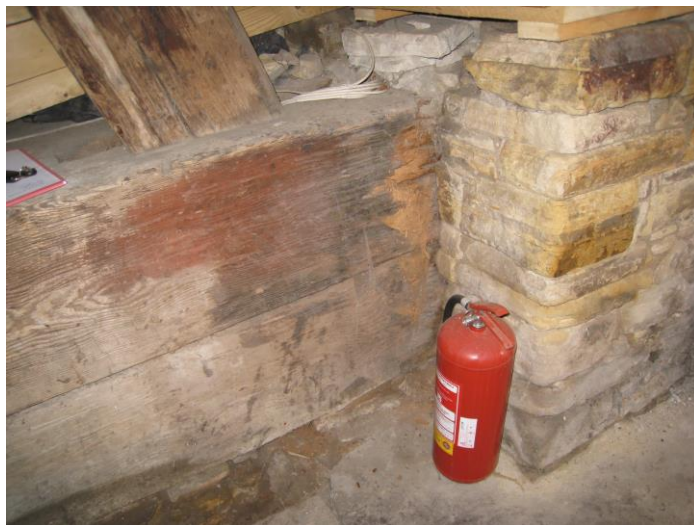
Poškozené zhlaví trámy u styku s podezdívkou