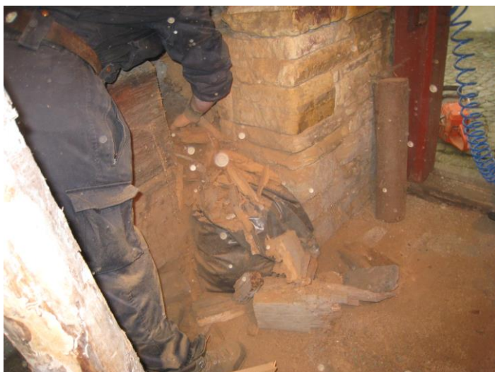
Práce na opravě – dřevo je zcela poškozené