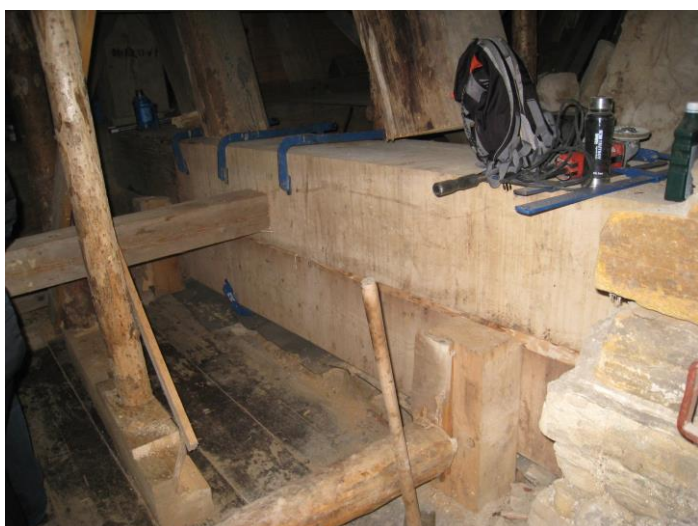
Práce na opravě – lepené spoje