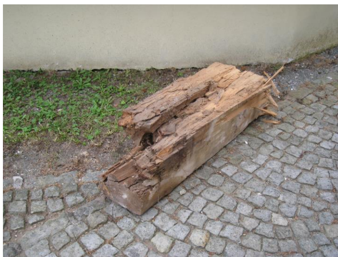
Napadená část trámu (outkovka řadová)