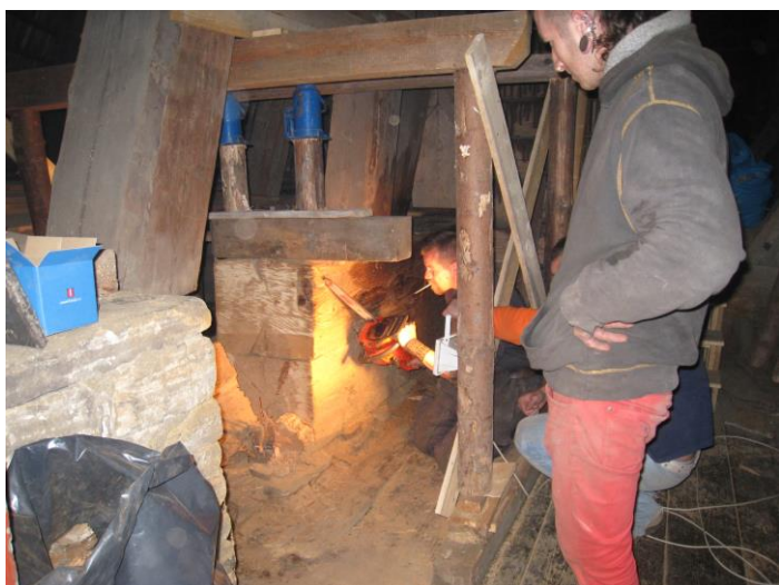
Práce při opravě – zvednutí zvonice hevery