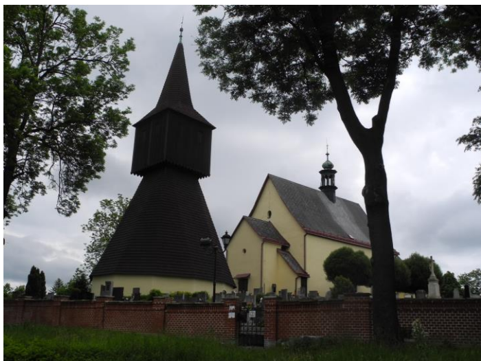
Celkový pohled na zvonici u kostela Jana Křtitele