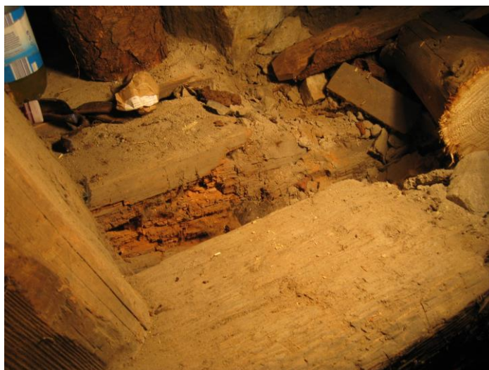
Zcela poškozené dřevo (dřevokazná houba outkovka)