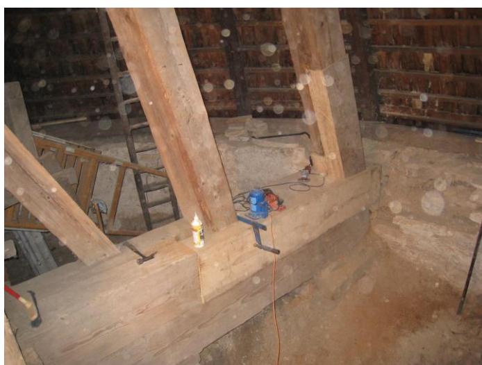
Opravená část spodní konstrukce zvonice